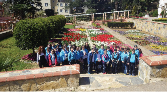
Merkeze yapılan öğrenci ziyaretleri