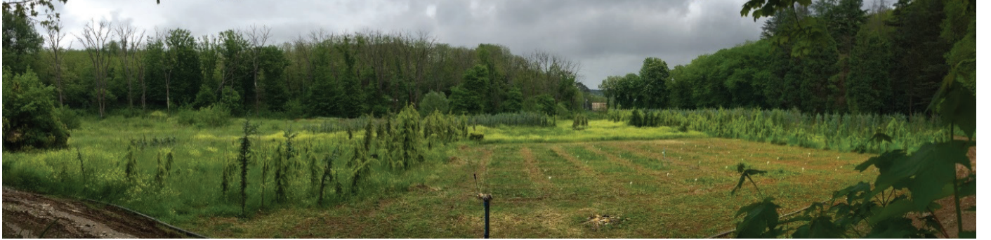
Kurum Arazisindeki Sibirya Bölgesi