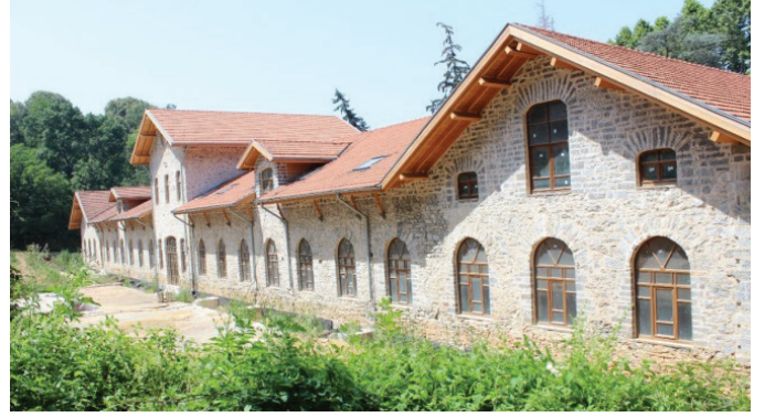
Abraham Paşa Çiftliği Uluslararası Eğitim Merkezi