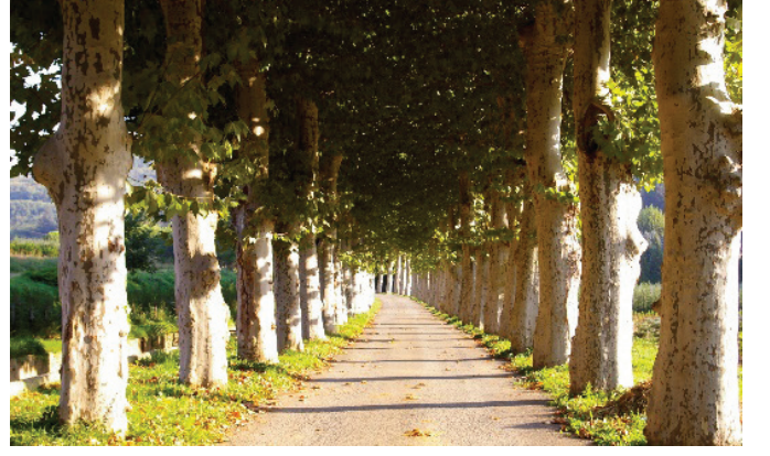
Tarihi Çınarlı Yol