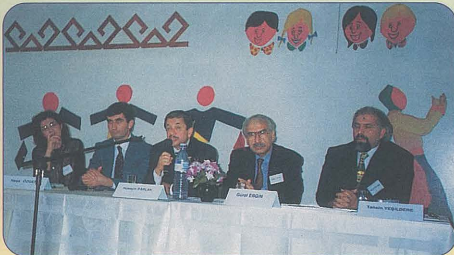
GAP'tan sorumlu Devlet Bakanı Prof.Dr. Salih Yıldırım, ODA Başkanı Prof.Dr. Gürol Ergin ve diğer konuşmacılar İdil'deki Panel'de.

Sorunları; Çözüm Önerileri" başlıklı bildiriler sundular. İdil'in önceki kaymakamı Hüseyin Parlak'ı yöneticisi olduğu ilçeyi geliştirmek için gösterdiği çabalar ve sivil toplum örgütleriyle işbirliği içerisindeki çalışmaları için kutluyor ve tüm yöneticilere örnek olmasını diliyoruz.