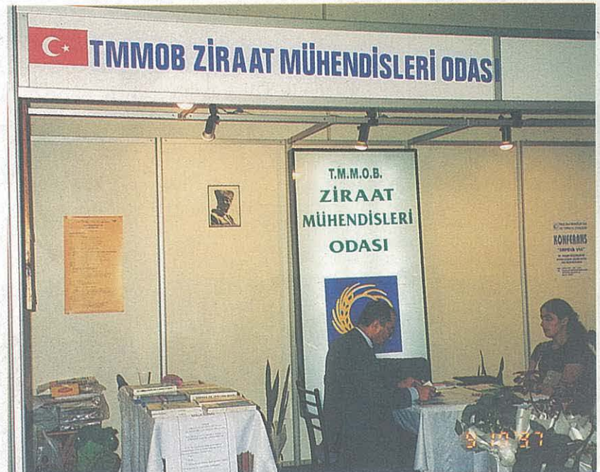
LİFEPO'97 Fuarındaki ODA'mız Standı