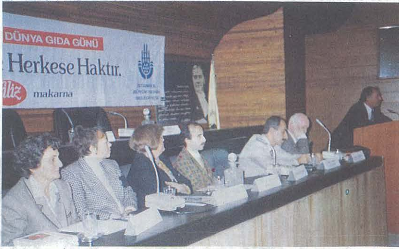
Dünya Gıda Günü Paneline Katılan Konuşmacılar

Türkiye'nin yapması gereken uygulama tarım dışı olan her türlü faaliyeti son derece değerli olan I. ve II. sınıf toprakların dışında gerçekleştirmesidir. İster kentsel, ister endüstriyel olsun tarım dışı yapı, tesis ve yatırımlar ilk dört sınıfın dışındaki alanlarda gerçekleştirilebilir.