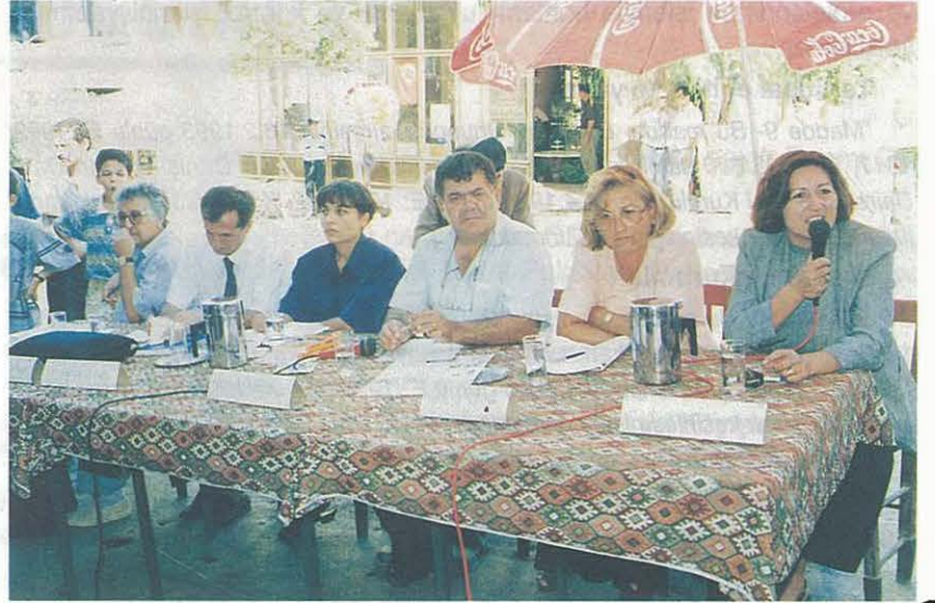
Beydağ İncir Üretimi ve Sorunları Panel'ine Katılan Konuşmacılar

"Türkiye'de bir baş hayvanın karkas ağırlığı 143 kg iken bu ağırlık Amerika'da 300 kg, bir ineğin yıllık süt verimi ülkemizde 1500 litre iken ABD'de 5000 litrenin üstündedir. Türkiye'de de Avrupa ve Amerikadaki verimliliğe ulaşabil-