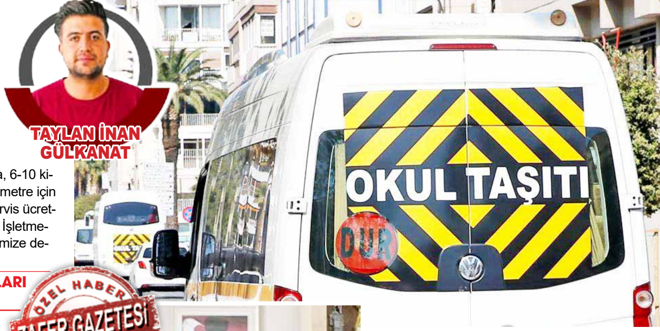
TAYLAN İNAN GÜLKANAT

Özel okulların belirlenen ücretin 2-3 katı paralar istediğini belirten Elmadağlı “Ne kadar doğru? Bilmiyorum ama geçenlerde bir özel okulda 90 bin TL ücret istendiği bilgisi kulağıma geldi. Ba-